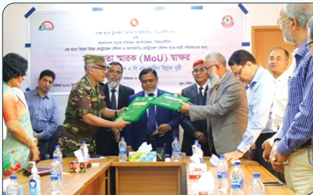
ডিএমটিসিএল -এর সাথে বিআরটিসি'র MoU সমঝোতা স্মারক স্বাক্ষর