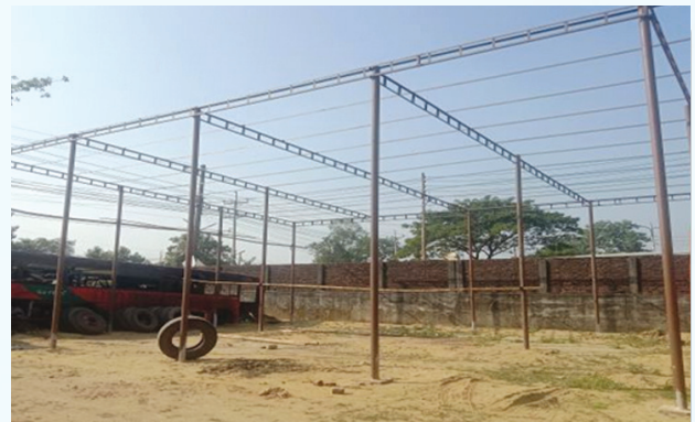
বিআরটিসি সিলেট বাস ডিপো ও প্রশিক্ষণ কেন্দ্রের মেরামত শেড নির্মাণ কাজ চলমান