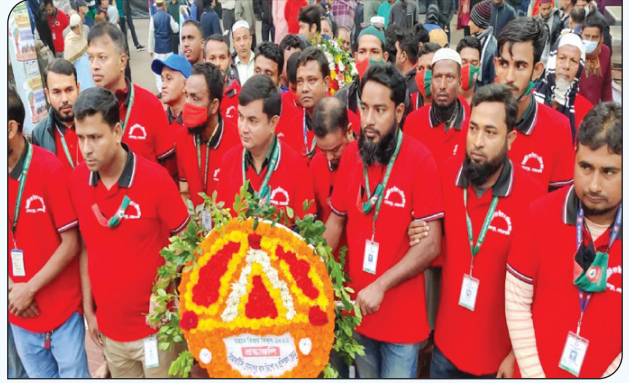
মহান বিজয় দিবসে ফুল দিয়ে শুভেচ্ছা জানাচ্ছেন সোনাপুর বাস ডিপো ও প্রশিক্ষণ কেন্দ্রের কর্মকর্তা ও কর্মচারীবৃন্দ