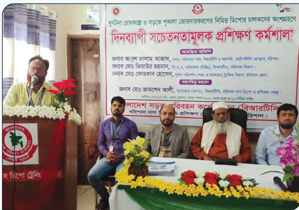
দুর্ঘটনা রোধকল্পে ও সড়কে শৃঙ্খলা জোরদার করার নিমিত্তে বরিশাল বাস ডিপোর চালকদের সচেতনতামূলক প্রশিক্ষণ প্রদান