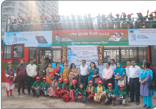
শেখ রাসেল দিবস উপলক্ষে পথশিশুদের নিয়ে ছাদ খোলা বাসে পদ্মা সেতু ভ্রমণ