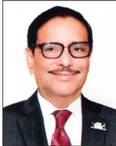
ওবায়দুল কাদের, এমপি মাননীয় মন্ত্রী সড়ক পরিবহন ও সেতু মন্ত্রণালয়

“ক্রমবর্ধমান দক্ষ চালকের চাহিদা পূরণে বিআরটিসি'কে অগ্রণী ভূমিকা পালন করতে হবে।”