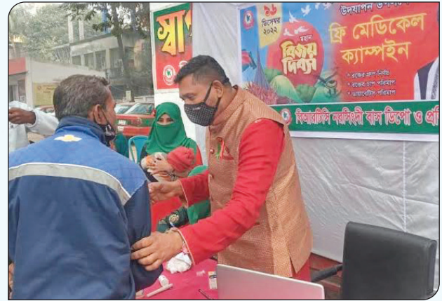
বিআরটিসি নরসিংদী বাস ডিপো ও প্রশিক্ষণ কেন্দ্রের উদ্যোগে ফ্রি মেডিকেল ক্যাম্পেইন