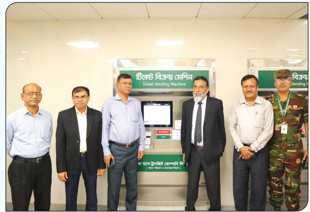
মেট্রোরোলে স্বয়ংক্রিয় টিকেট কাউন্টারে বিআরটিসি'র চেয়ারম্যান ও অন্যান্য ব্যক্তিবর্গ