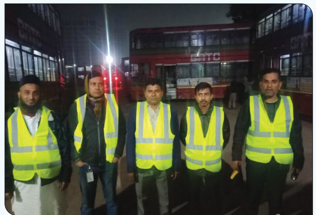
সকল ডিপো/ইউনিটে নিরাপত্তা কার্যক্রম জোরদার করা হয়েছে