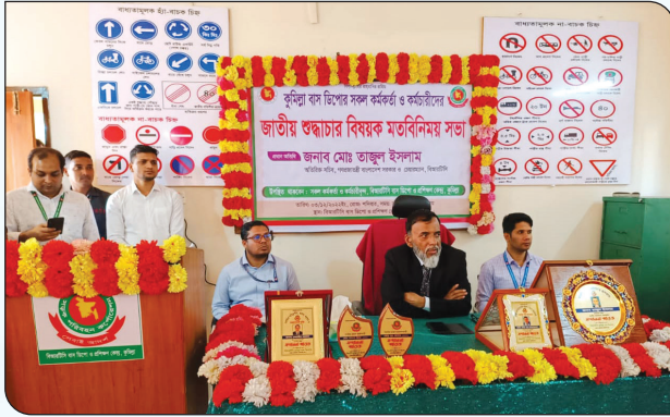
বিআরটিসি'র কর্মকর্তা/কর্মচারীদের কর্মদক্ষতা বাড়াবার লক্ষ্যে ১৮ খেড তদূর্ধ্ব কর্মরত নারীদের দক্ষতা বিষয়ক প্রশিক্ষণ সভায় ক্রেস্ট ও সমাচার প্রদান করছেন বিআরটিসি চেয়ারম্যান