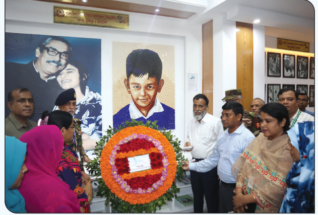
বিআরটিসি প্রধান কার্যালয় কর্তৃক শেখ রাসেল দিবসে পুষ্পস্তবক অর্পণ