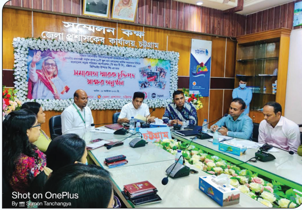
মাননীয় প্রধানমন্ত্রী কর্তৃক প্রদত্ত ১০টি স্কুল বাস চলাচলের আর্থিক সহায়তার নিমিত্তে বিআরটিসি ও জিপিএইচ ইম্পাত লিঃ এর সাথে স্মারক স্বাক্ষর