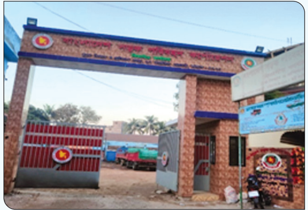
চট্টগ্রাম ট্রাক ডিপোর নির্মাণাধীন মেইন গেটের স্থির চিত্র