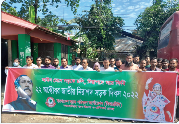
ময়মনসিংহ বাস ডিপো কর্তৃক নিরাপদ সড়ক দিবস