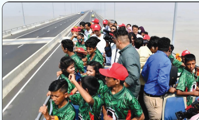
বিআরটিসির ছাদখোলা বাসে পদ্মা সেতু ঘুরিয়ে দেখানো হয় পথশিশুদের।

সফজয়ী নারী ফুটবল দলের আক্ষেপ থেকে রাতারাতি একটি দোতলা বাসকে ছাদখোলা বাসে পরিণত করা হয়। সরকারের পরিবহন সংস্থা বিআরটিসি এ বাস পুনরায় যাত্রীবাহী বাসে পরিণত করবে, এমনটাই পরিকল্পনা ছিল। কিন্তু ছাদখোলা বাসের আবেদন আছে, এ বিবেচনায় বাসটি ছাদখোলাই রেখে দেওয়া হয়। নতুন করে আরেকটি বাসের ছাদ খোলা হয়। এবার শেখ রাসেল দিবস উপলক্ষ্যে একটি ছাদখোলা বাসে এক ভিন্ন রকম আনন্দ ভ্রমণের আয়োজন করেছে বিআরটিসি। ৪০ জন পথশিশুকে আলোচিত পদ্মা সেতু দেখাতে নিয়ে যায় তারা।