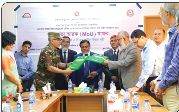
ডিএমটিসিএল -এর সাথে বিআরটিসি'র MoU সমঝোতা স্মারক স্বাক্ষর