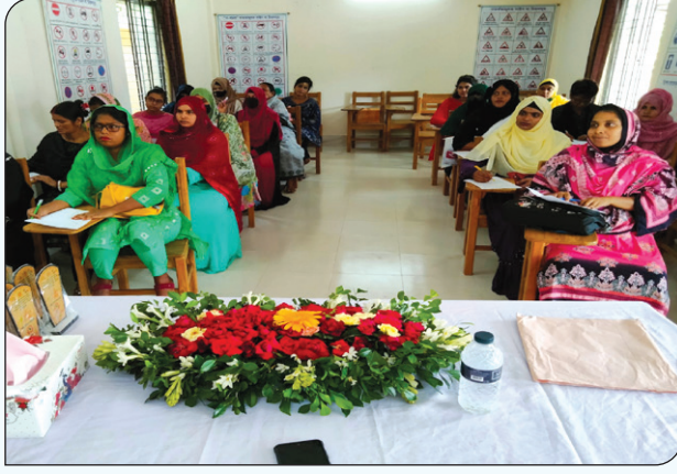
রংপুর প্রশিক্ষণ কেন্দ্রের অক্টোবর/২০২২ আইজিএ প্রকল্পের মহিলা প্রশিক্ষণার্থী ৪র্থ ব্যাচের কোর্স সমাপনী অনুষ্ঠান