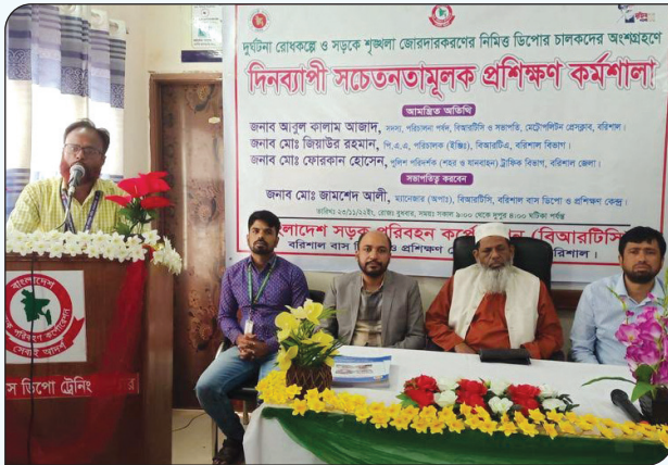
দুর্ঘটনা রোধকল্পে ও সড়কে শৃঙ্খলা জোরদার করার নিমিত্তে বরিশাল বাস ডিপোর চালকদের সচেতনতামূলক প্রশিক্ষণ প্রদান