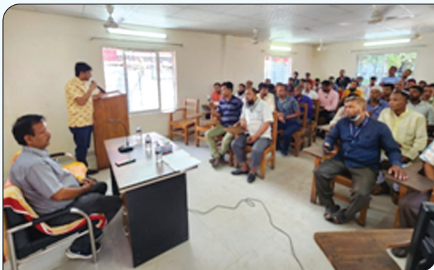
নারায়ণগঞ্জ বাস ডিপো ও প্রশিক্ষণ কেন্দ্রের কর্মকর্তা-কর্মচারীদের বিভিন্ন বিষয়ে দিক নির্দেশনা প্রদান করা হচ্ছে