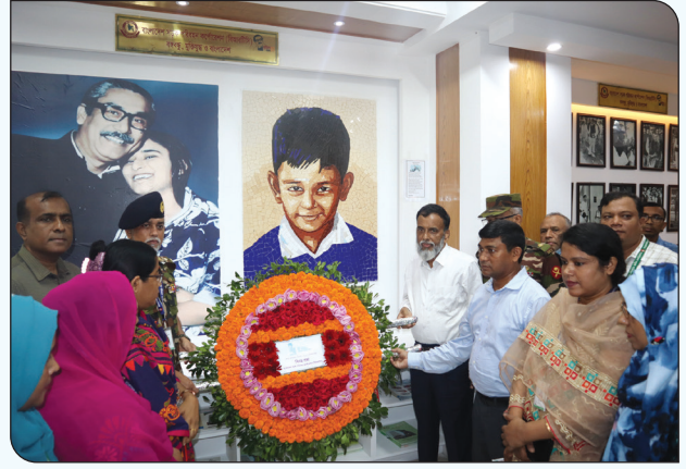
বিআরটিসি প্রধান কার্যালয় কর্তৃক শেখ রাসেল দিবসে পুষ্পস্তবক অর্পণ