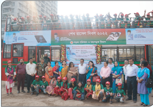
শেখ রাসেল দিবস উপলক্ষে পথশিশুদের নিয়ে ছাদ খোলা বাসে পদ্মা সেতু ভ্রমণের পূর্বে কর্মকর্তাবৃন্দ ও পথশিশুরা