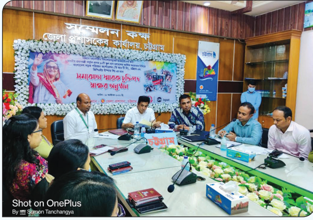
মাননীয় প্রধানমন্ত্রী কর্তৃক প্রদত্ত ১০টি স্কুল বাস চলাচলের আর্থিক সহায়তার নিমিত্তে বিআরটিসি ও জিপিএইচ ইম্পাত লিঃ এর সাথে স্মারক স্বাক্ষর