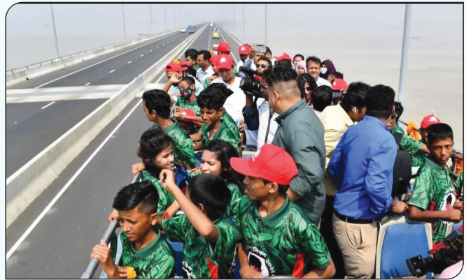
বিআরটিসির ছাদখোলা বাসে পদ্মা সেতু ঘুরিয়ে দেখানো হয় পথশিশুদের।

সার্বজনীন নারী ফুটবল দলের আক্ষেপ থেকে রাতারাতি একটি দোতলা বাসকে ছাদখোলা বাসে পরিণত করা হয়। সরকারের পরিবহন সংস্থা বিআরটিসি এ বাস পুনরায় যাত্রীবাহী বাসে পরিণত করবে, এমনটাই পরিকল্পনা ছিল। কিন্তু ছাদখোলা বাসের আবেদন আছে, এ বিবেচনায় বাসটি ছাদখোলাই রেখে দেওয়া হয়েছে। নতুন করে আরেকটি বাসের ছাদ খোলা হয়েছে। এবার শেখ রাসেল দিবস উপলক্ষ্যে নতুন আরেকটি ছাদখোলা বাসে এক ভিন্ন রকম আনন্দ ভ্রমণের আয়োজন করেছে বিআরটিসি কর্তৃপক্ষ। ভিন্ন এ আয়োজনে ৪০ জন পথশিশুকে বিআরটিসির নিজস্ব ব্যবস্থাপনায় পদ্মা সেতু ভ্রমণ এক অনন্য দৃষ্টান্ত সৃষ্টি করে।