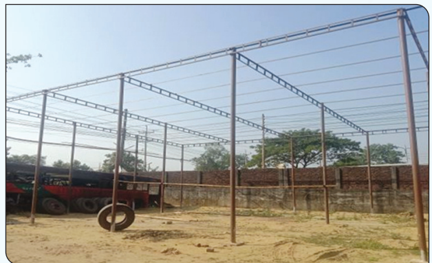
বিআরটিসি সিলেট বাস ডিপো ও প্রশিক্ষণ কেন্দ্রের মেরামত শেড নির্মাণ কাজ চলমান