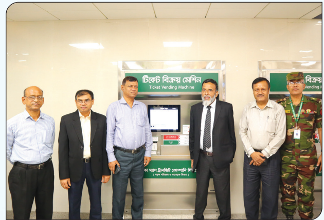
মেট্রোরেল স্বেচ্ছাসেবী টিকেট কাউন্টারে বিআরটিসি'র চেয়ারম্যান ও অন্যান্য কর্মকর্তাবৃন্দ