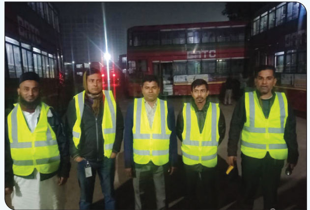
সকল ডিপো/ইউনিটে নিরাপত্তা কার্যক্রম জোরদার করা হয়েছে