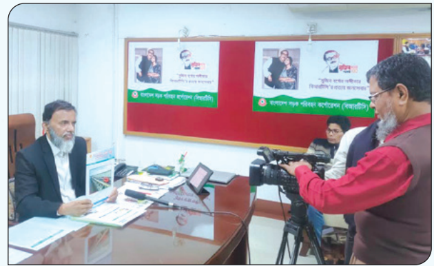
বিআরটিসি-এর বিভিন্ন উন্নয়নমূলক কর্মকাণ্ড নিয়ে বিশেষ সাক্ষাৎকার প্রদান