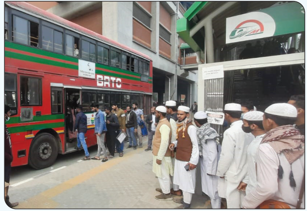
মেট্রোরেলের যাত্রীদের বিভিন্ন গন্তব্যে পৌঁছে দিচ্ছে বিআরটিসি