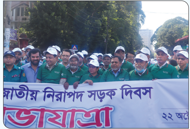
সড়ক পরিবহন ও মহাসড়ক বিভাগের সচিব মহোদয়ের নেতৃত্বে জাতীয় নিরাপদ সড়ক দিবস পালন