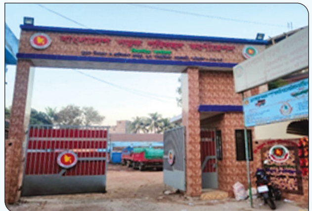
চট্টগ্রাম ট্রাক ডিপোর নির্মাণাধীন মেইন গেটের স্থির চিত্র