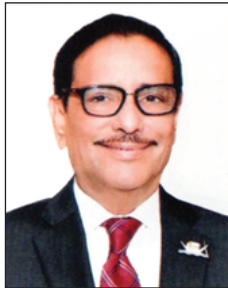
ওবায়দুল কাদের, এমপি মাননীয় মন্ত্রী সড়ক পরিবহন ও সেতু মন্ত্রণালয়

“ক্রমবর্ধমান দক্ষ চালকের চাহিদা পূরণে বিআরটিসি'কে অগ্রণী ভূমিকা পালন করতে হবে।”