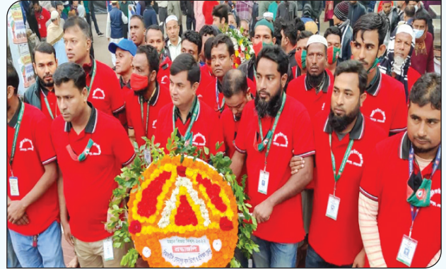
মহান বিজয় দিবসে উদযাপনে সোনাপুর বাস ডিপো ও প্রশিক্ষণ কেন্দ্রের কর্মকর্তা ও কর্মচারীবৃন্দ