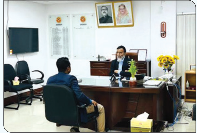
মেট্রোরেলের যাত্রীদের গন্তব্যে পৌঁছে দেওয়ার বিষয় নিয়ে সাক্ষাৎকার প্রদান