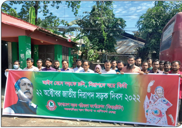
ময়মনসিংহ বাস ডিপো কর্তৃক নিরাপদ সড়ক দিবস পালন