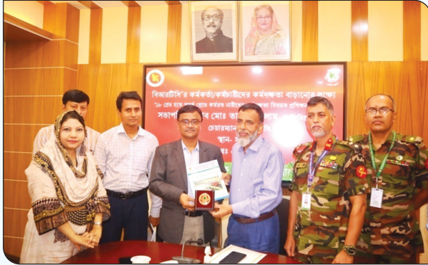
বিআরটিসি'র কর্মকর্তা/কর্মচারীদের কর্মদক্ষতা বাড়াবার লক্ষ্যে ১৮ গ্রেড তদুর্ধ্ব কর্মরত নারীদের দক্ষতা বিষয়ক প্রশিক্ষণ সভায় ক্রেস্ট ও সমাচার প্রদান করছেন বিআরটিসি'র চেয়ারম্যান