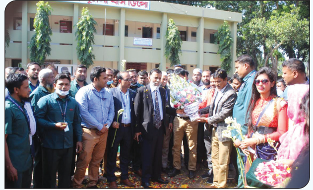
খুলনা বাস ডিপো পরিদর্শনকালে চেয়ারম্যান, বিআরটিসি'কে ফুলেল শুভেচ্ছা