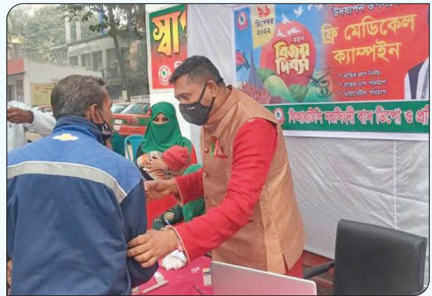
বিআরটিসি নরসিংদী বাস ডিপো ও প্রশিক্ষণ কেন্দ্রের উদ্যোগে ফ্রি মেডিকেল ক্যাম্পইন