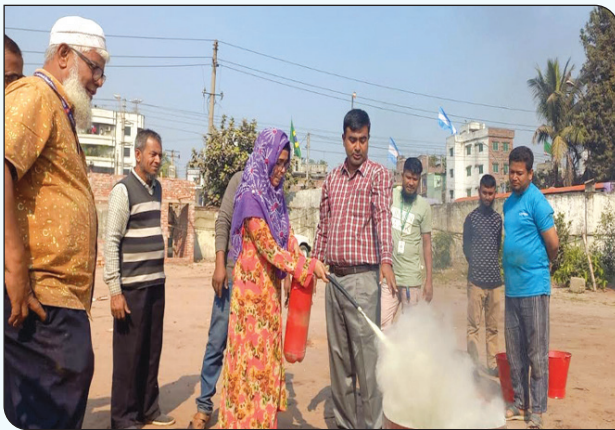
গাবতলী বাস ডিপো কর্তৃক কর্মকর্তা-কর্মচারীদের অগ্নি নির্বাপন প্রশিক্ষণ